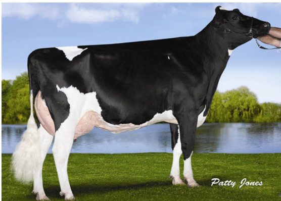
RANSOM-RAIL FACEBK PARIS FOURTH DAM