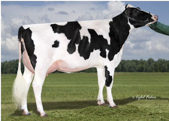
SIEMERS GRT PARINI 28262 DAM